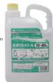
5倍広口希釈ボトル 専用希釈ボトル 商品コード:148202

* 寸法は幅 × 奥行 × 高さを設計値で記載しています。 ・商品の外観・表示については予告なく変更することがあります。